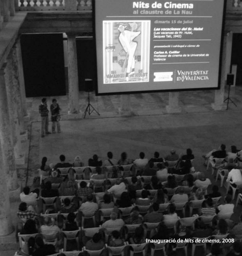
Inauguració de Nits de cinema, 2008