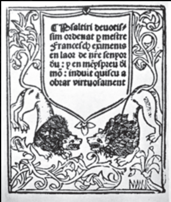
Traducció al valencià del Psalteri , obra de Francesc Eiximenis originàriament escrita en llatí (Girona, 1495).