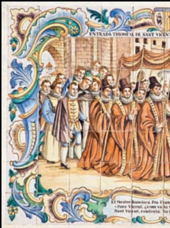
Retaule ceràmica de 1957 que recorda l'encontre entre Francesc Eiximenis i sant Vicent Ferrer.