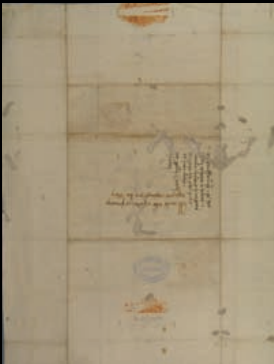
València, 15 de juliol de 1392. Carta autògrafa d'Eiximenis dirigida a l'infant Martí. Ministeri de Cultura. Arxiu de la Corona d'Aragó (col·lecció «Autògrafs II-A-8 [1]»).