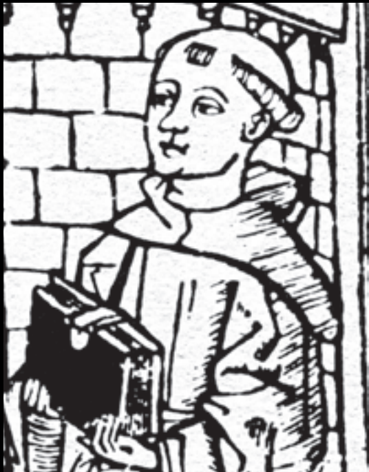
Francesc Eiximenis, representat en una edició del Regiment de la cosa pública de 1499.