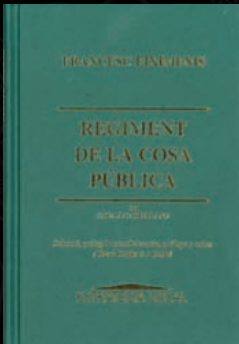
Francesc Eiximenis. Regiment de la cosa pública . Barcelona: Estratègia Local, 1999. Biblioteca Valenciana.