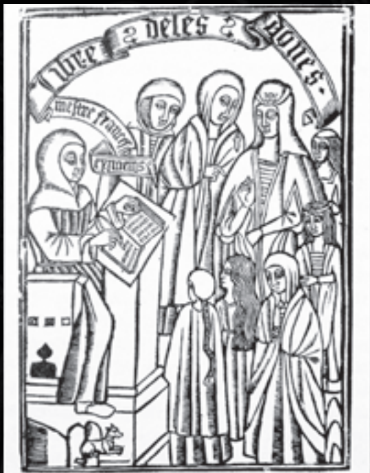
Gravat del Llibre de les dones (edició de 1495). L'autor apareix representat a l'esquerra.